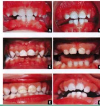
A. Normal 12- to 14-month-old infant's mouth. B. Infant's mouth with plaque. C. Decalcification and early cavitation. D. Remineralized decalcified enamel. E. Hypoplastic enamel (no decay). F. Fractured primary teeth.