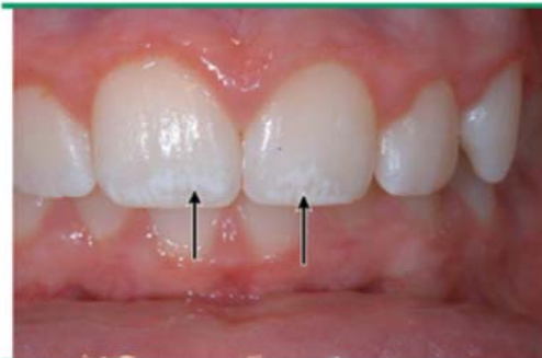
Mild fluorosis is indicated by a white flecked or lacy appearance to the enamel