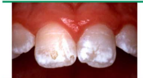
These incisors with moderate fluorosis have an opaque white appearance and a round lesion where hypomineralized enamel has been abraded from the surface during normal function.