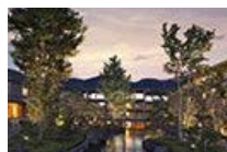
東急ハーヴェストクラブ VIALA箱根翡翠