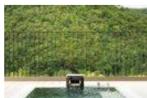
東急ハーヴェストクラブ VIALA annex京都鷹峯