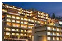
東急ハーヴェストクラブ VIALA annex有馬六彩