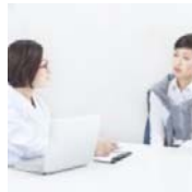
現役医師がホンネで働… おととい