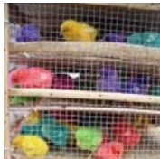
薬で肌が真っ青になっ… 今日