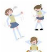
治りにくい貧血やじん… 昨日