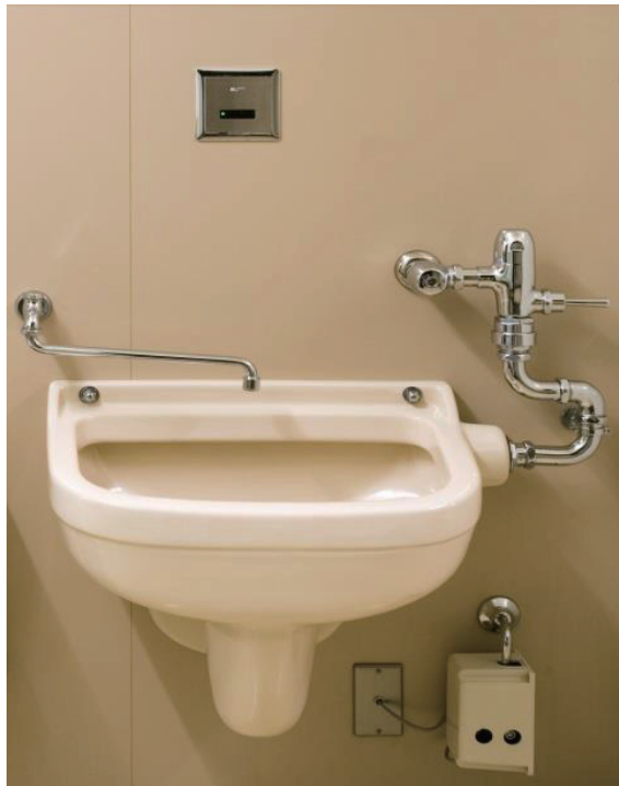
Figure 1 センサー式活栓.