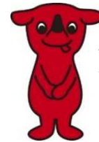
千葉県マスコット キャラクター 「チーバくん」