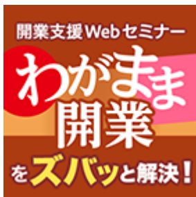
自己資金ゼロで開業したい！