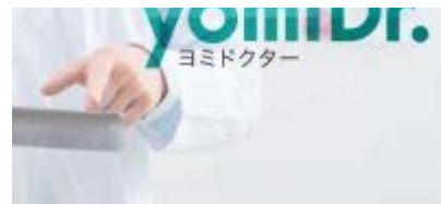
医学部入試不正、日大「辞退多く子弟で入学者確保」...報告書〔読売新聞〕