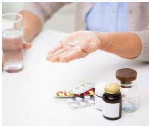
高齢者へのPPI処方、3分の1は不要