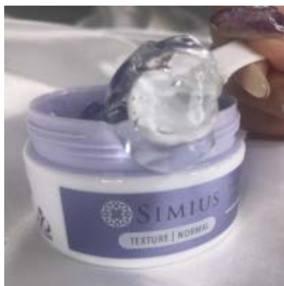
「レーザー治療より断然こっち！」頑固なしみがたった数日で...