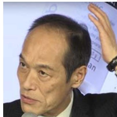
かつら業界が悲鳴！モンドセレクション最高金賞の「育毛剤」が凄い