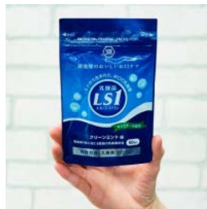
「歯ブラシの届かない所、どうしてる？」湖池屋の口腔ケア乳酸菌