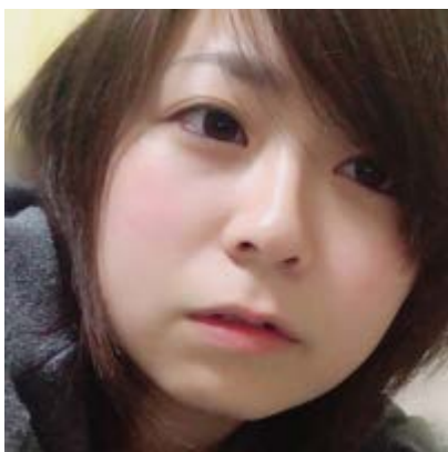
42歳主婦が実践！アテナア新作でブルドック並みのほうれい線が